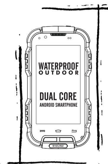
EVOLVEO StrongPhone D2