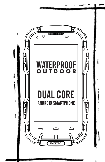
EVOLVEO StrongPhone D2