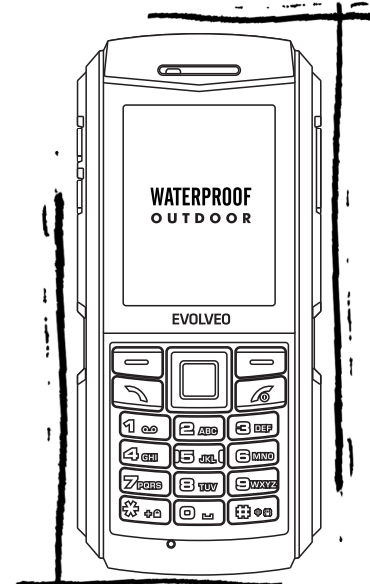
EVOLVEO StrongPhone X1